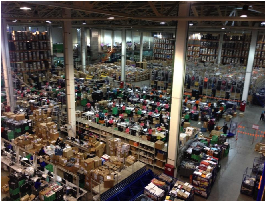
Склад Wildberries. Источник .

При поставке товара могут возникать такие проблемы, как недогруз, пересорт или брак товара. В этом случае со стороны интернет-магазина формируется и подписывается Акт об установленном расхождении (ТОРГ-2) на основании товарной накладной (ТОРГ-12), этот акт должен быть подписан поставщиком. Акт отправляется поставщику его экспедитором, а тот, соответственно, подписывает его и формирует корректировочный счет-фактуру (КСФ). Таким образом, подписанный уже двумя сторонами ТОРГ-2 и КСФ комплектом должны быть отправлены магазину обратно.