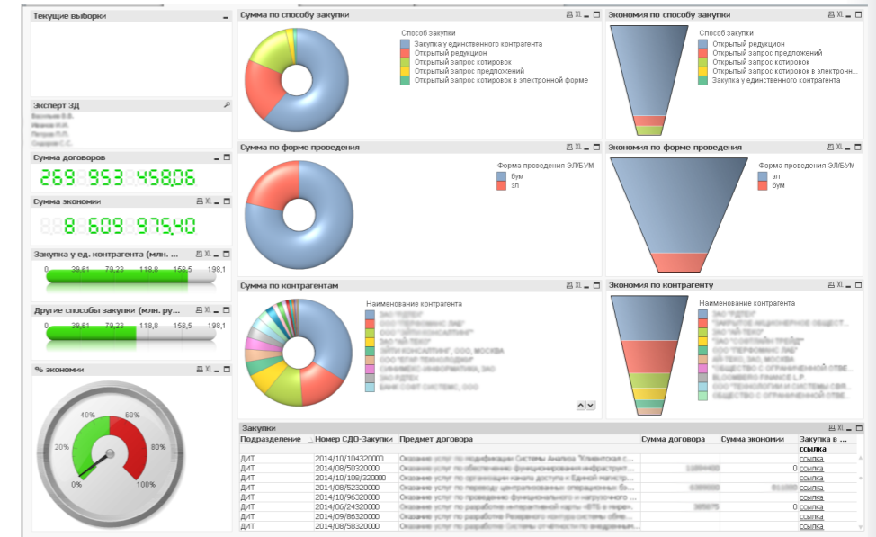
Рис. 2. Аналитика закупок в разрезе экономии средств.

Стоимостной и количественный анализ по закупкам. Пример более продвинутой аналитики — мониторинг данных, касающихся процесса тендерных закупок, характерного для крупных компаний и корпораций с большой долей государственного участия. Закупочная деятельность автоматизируется с помощью специализированного модуля CompaуMedia, анализ может касаться различных показателей, в том числе масштаба экономии средств. Система позволяет визуализировать финансовые характеристики закупок (Рис. 2). Форма представления данных и параметры диаграмм гибко настраиваются. Анализ количественных характеристик закупочной деятельности возможен в различных разрезах: по экспертам, формам проведения, подразделениям, способам закупок (Рис. 3).