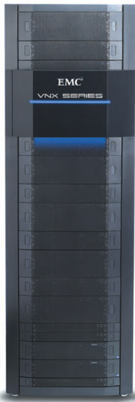
EMC VNX 5700

может не только управлять аппаратными ресурсами массивов, но и всем функционалом по локальной и удаленной репликации, а также вести непрерывный оперативный мониторинг.