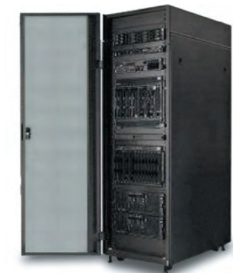
IBM CloudBurst — интегрированное решение для облачных вычислений

На экспозиции систем хранения данных (СХД), представленной в рамках прошедшей в конце сентября в московском выставочном центре “Сокольники” международной выставки “InfoSecurity Russia. StorageExpo. Documation — 2011”, организованной компанией “Гротек”, четко прослеживались две тенденции — облака и виртуализация. Поскольку облачные решения предполагают использование технологии виртуализации, эти два взаимосвязанных направления можно рассматривать (в контексте облаков) как единый тренд.